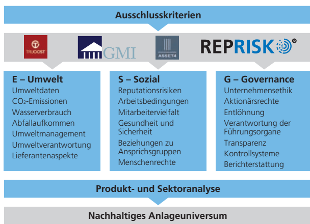
Abbildung 4: Selektion der Branchenleader nach ESG-Daten, d. h. Umwelt, Soziales und Corporate Governance