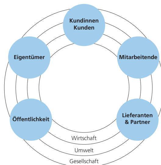
Abbildung 1: Nachhaltigkeit als integriertes Geschäftsprinzip

Die Zürcher Kantonalbank vernetzt sich im Bereich Nachhaltigkeit mit kompetenten Partnern wie dem WWF Schweiz. Seit 2007 verfolgen wir gemeinsam das Ziel, Lösungen für umweltfreundliche und nachhaltige Bankgeschäfte zu entwickeln und die Bevölkerung dafür zu sensibilisieren. Im Zentrum der Partnerschaft steht dabei die Produktlinie Nachhaltigkeit. 2009 hat die Zürcher Kantonalbank als eine der ersten europäischen Universalbanken die PRI (Principles for Responsible Investments) unterzeichnet. Als weiterführende Massnahme dieser umfassenden finanzmarktrelevanten Umwelt-, Sozial- und Governanceprinzipien lancierte die Zürcher Kantonalbank 2011 den Nachhaltigkeitsindikator. Der Indikator beurteilt die Nachhaltigkeit von Anlagefonds und bringt damit Transparenz ins Kundenportfolio.