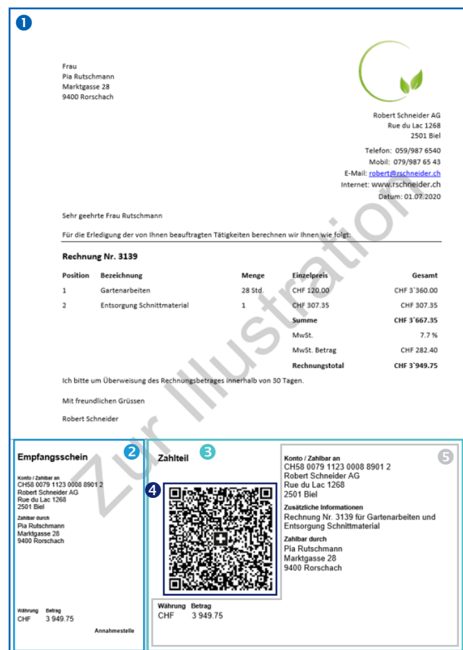
QR-Rechnung mit Zahlteil